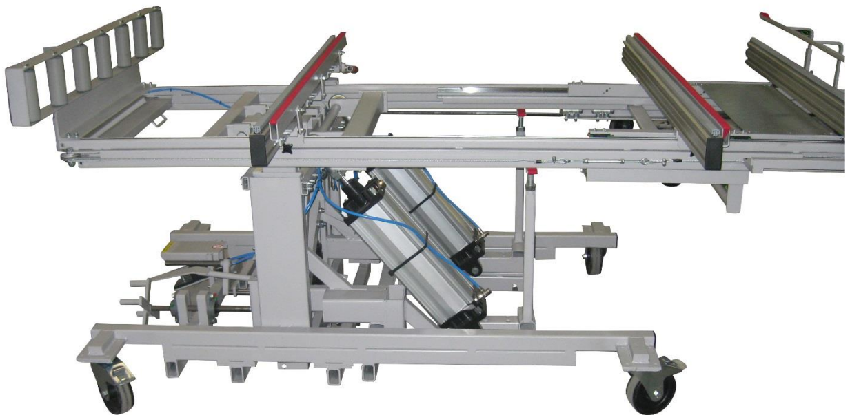
RU-TKE-AP mit Optionen Hub hydraulisch und 2x Filzleiste

Im Zusammenspiel mit Rollenbahnen, Fachwagen und Arbeitstischen ist die komplette Fertigung von Türelementen möglich ohne schwere Teile heben zu müssen.