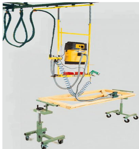
RU-GH-4DEW, 4 Druckluftanschlüsse und 4 Elektroanschlüsse. Mit Halterung für Handgeräte