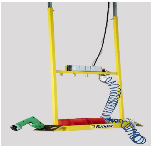
RU-GH-4 DEW mit zusätzlicher Ablage