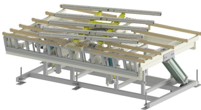
Table basculante pour le montage sophistiqué des fenêtres.