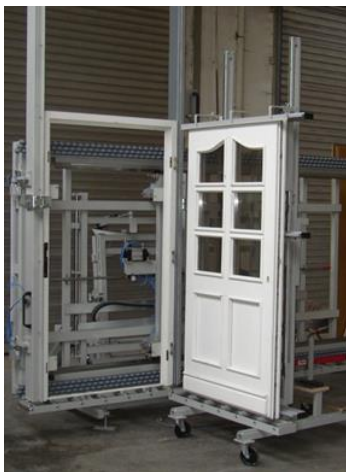
RU-HKS et RU-TKE

Le poste de montage et de contrôle pour portes d'entrée RU-HKS-83°/90° avec dossier inclinable de 83° à 90° et équipé d'un dispositif de vissage manuel de tasseaux ou de cartons de protection. Une poutre de serrage (au choix à gauche ou à droite) rabattable, une deuxième poutre mobile pour le serrage des cadres, guidée sur rails et crémaillères en haut et en bas pour synchroniser le mouvement de cadrage et garantir une pression parallèle sur le cadre. Hauteur de la poutre de serrage 2400 mm, Plage de serrage 300 - 3000 mm, Dispositif de basculement pneumatique avec position de basculement vertical à 83° et 90°. Le dossier est relevable, course 200mm, avec vérin pneumatique.